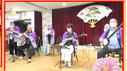
フビノス出展作品(GH)