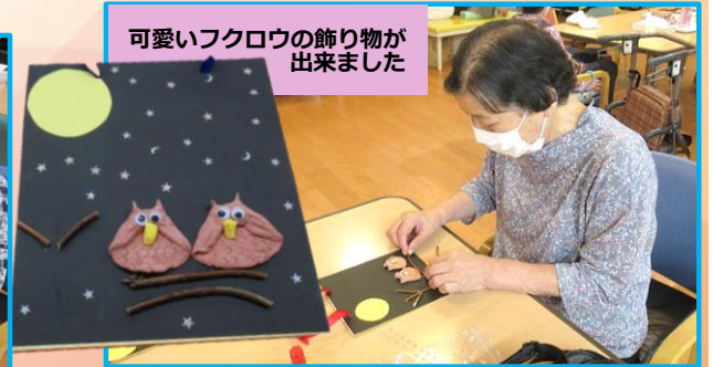
可愛いフクロウの飾り物が出来ました